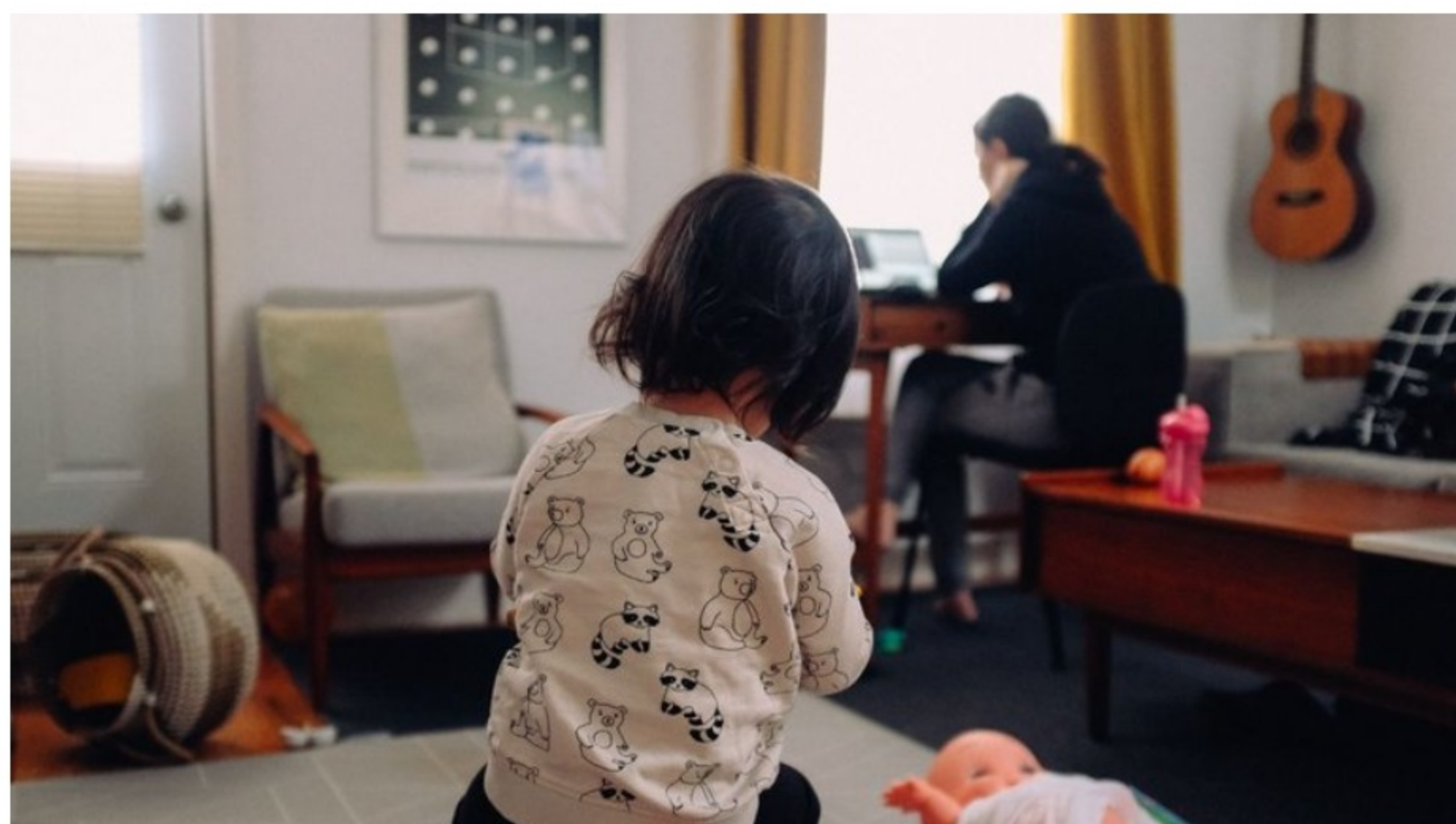
El 5% de los trabajadores solía teletrabajar antes de la pandemia

Instancias de diálogo y sentido de equipo parecen ser los mejores consejos para tratar de ayudar a que los empleados no se transformen en "telequemados"