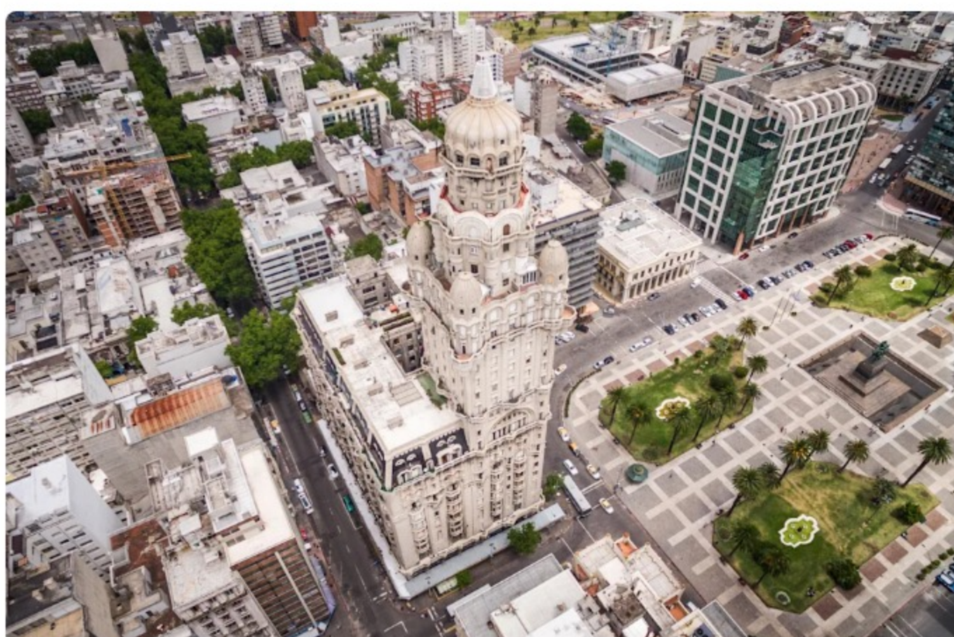
Los socios de dLocal suman con su patrimonio el 10% del PIB de Uruguay en 2020.