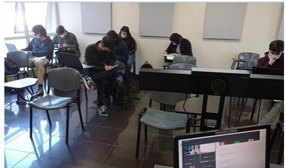
Fig. 4 Clase del curso

Todas las clases fueron grabadas y subidas al sitio de la materia en la misma semana de la clase. La subida fue realizada por ese mismo equipo, simplificando la tarea del docente.