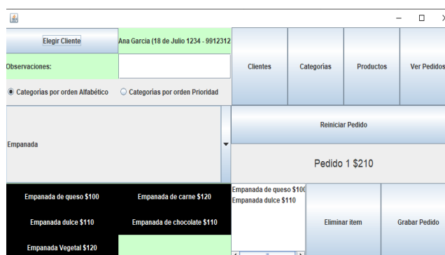
Fig. 3 Rotisería

El estilo, dificultad y enfoque de los obligatorios y parcial son similares a dictados previos. Para las correcciones de todos los trabajos se usan rúbricas comunes a todos los docentes, y que además son compartidas con los estudiantes.