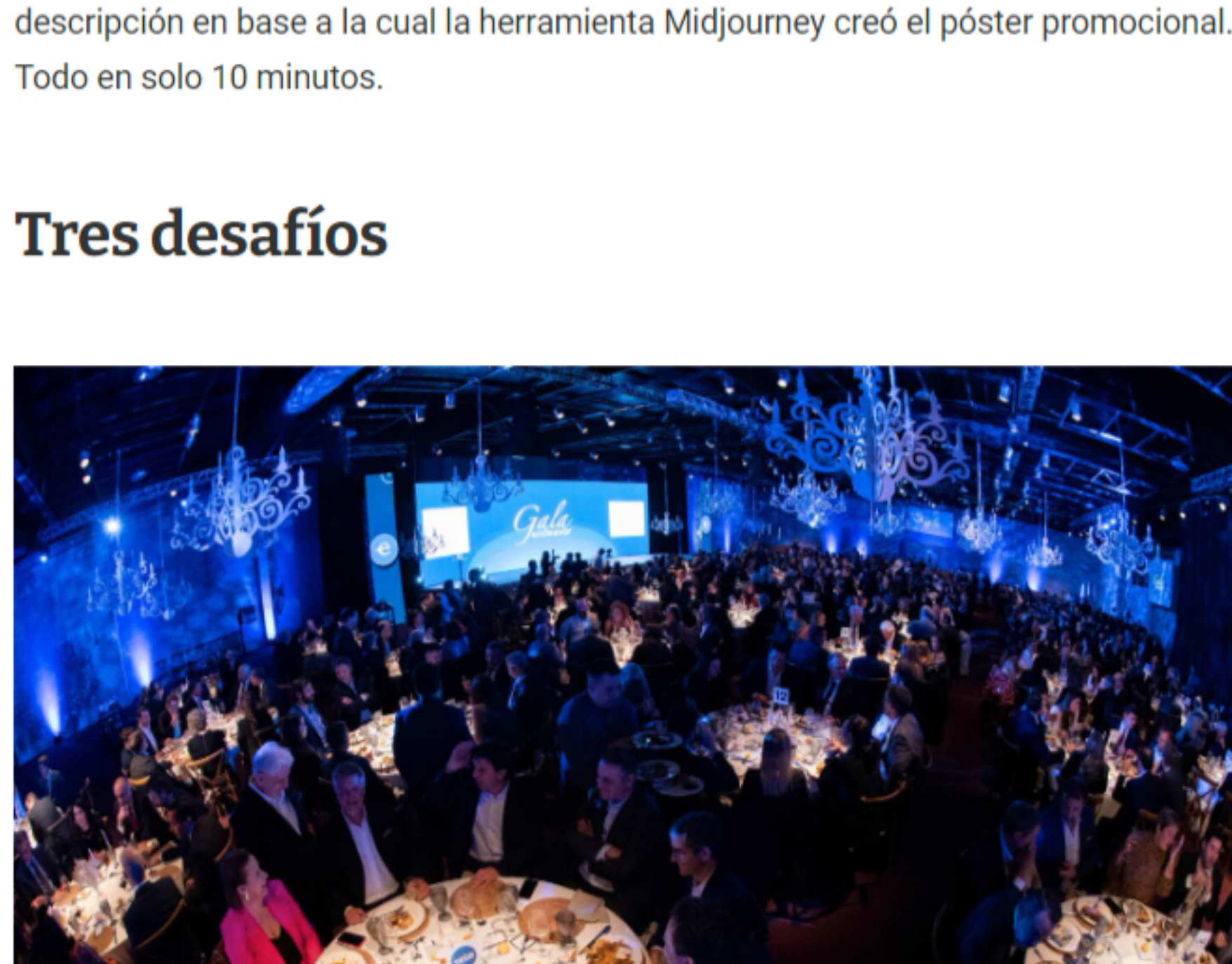
La Cena de Gala de Endeavor convocó a más de 750 empresarios, emprendedores y representantes de gobierno.

Mangarelli reconoció que el avance de la IAG trae aparejados desafíos. La falta de garantías en la privacidad de los datos provocó que a fines de marzo Italia bloquee el uso de ChatGPT. Sin embargo, a mediados de abril, OpenAI agregó una funcionalidad por la que el usuario puede evitar que la plataforma guarde sus datos. Ese cambio desactivó la prohibición en Italia.