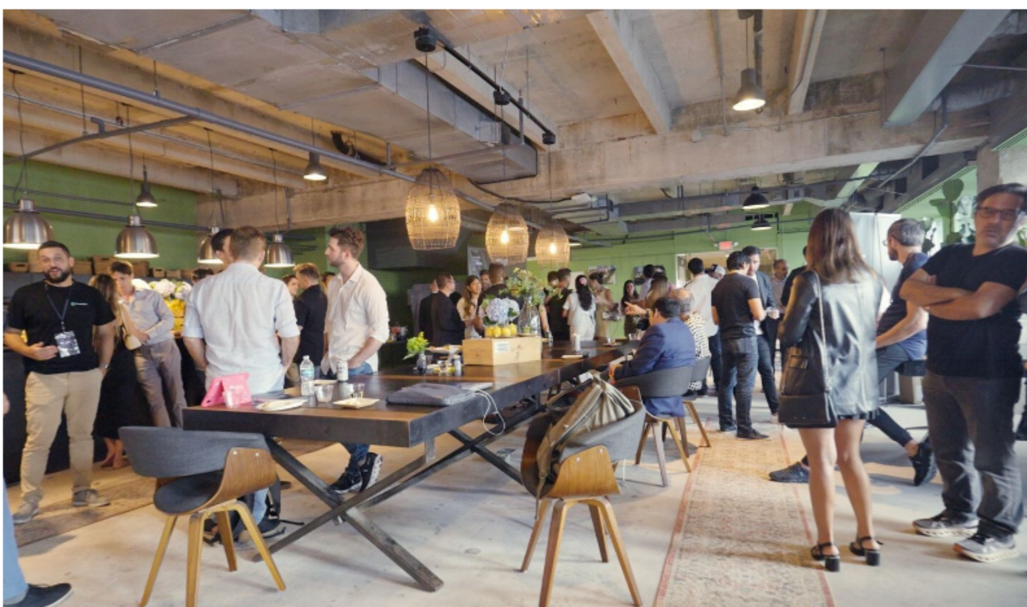
Mana Tech. El hub tecnológico organizó 70 eventos para empresas del sector de Latinoamérica.

Mana Tech es una de ellas. Allí trabajan con organismos latinoamericanos o grandes corporaciones como Microsoft , y ofrece su programa que prepara startups para desembarcar en EE.UU. desde hace unos cuatro años. Además de capacitación y preparación para llegar a ese mercado y presentar la empresa a clientes y posibles socios, también cuenta con un espacio de coworking para la comunidad emprendedora , explicó Esnal. «Queremos ser el lugar para que el emprendedor pueda instalarse rodeado de gente de la comunidad. En cuanto a los programas, hemos sumado de Uruguay a la incubadora Ingenio, Uruguay XXI y el BID . Hemos llevado inversores americanos a Uruguay», indicó.