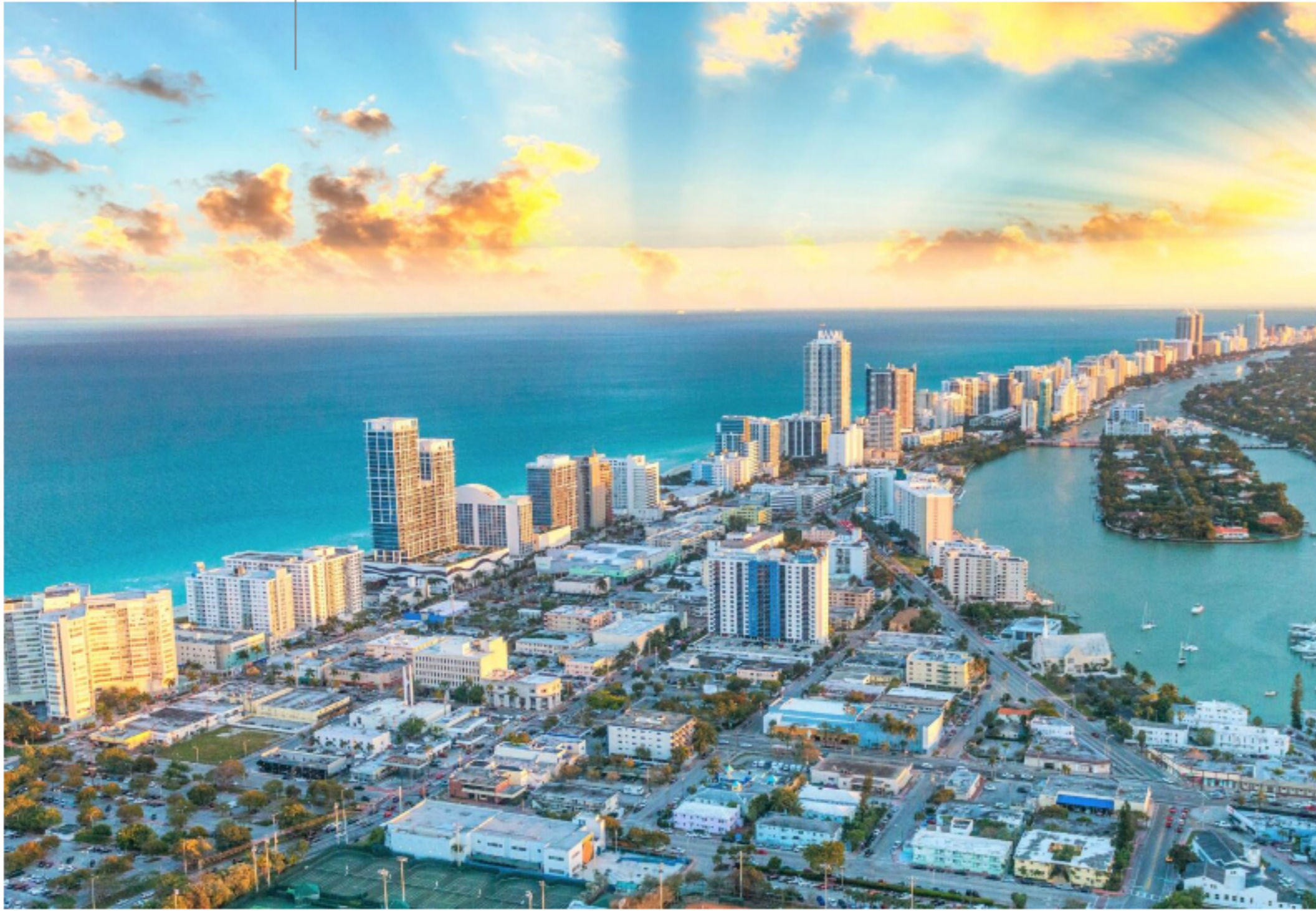
Miami. La zona de EE.UU. es un nuevo destino de empresas tecnológicas uruguayas

Este contenido es exclusivo para nuestros suscriptores.