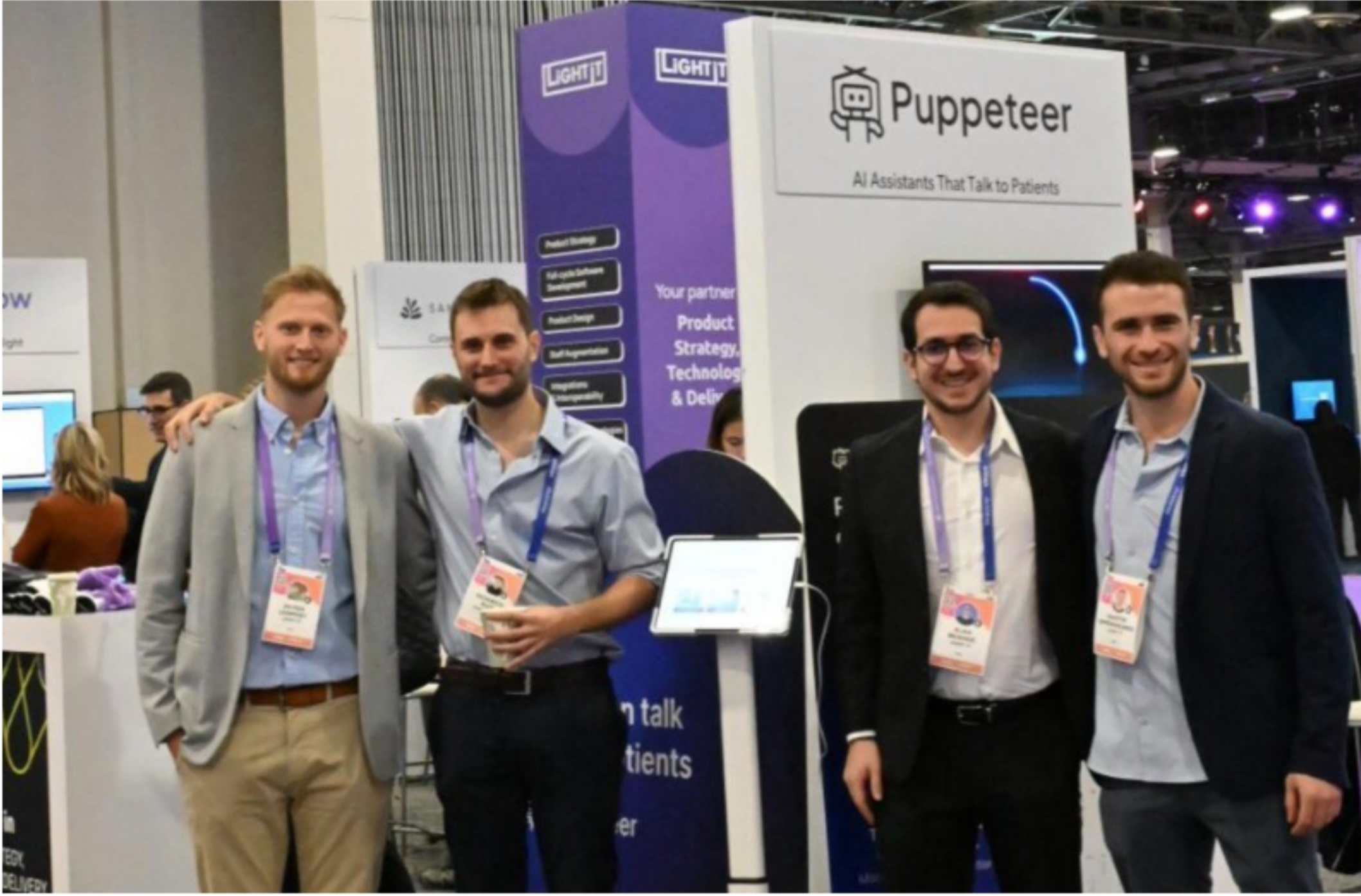
Puppeteer: La startup se creó dentro de la empresa uruguaya Light-IT.

La solución de Puppeteer es una herramienta conversacional con IA que permite automatizar ciertas acciones en una empresa de salud. Esto abarca desde la atención primaria en el área administrativa para solicitar una cita o remedios, identificar cuál es el médico adecuado para el paciente y armar un perfil previo para un médico, hasta realizar un seguimiento personalizado de un tratamiento con recordatorios al paciente para la toma de medicamentos.