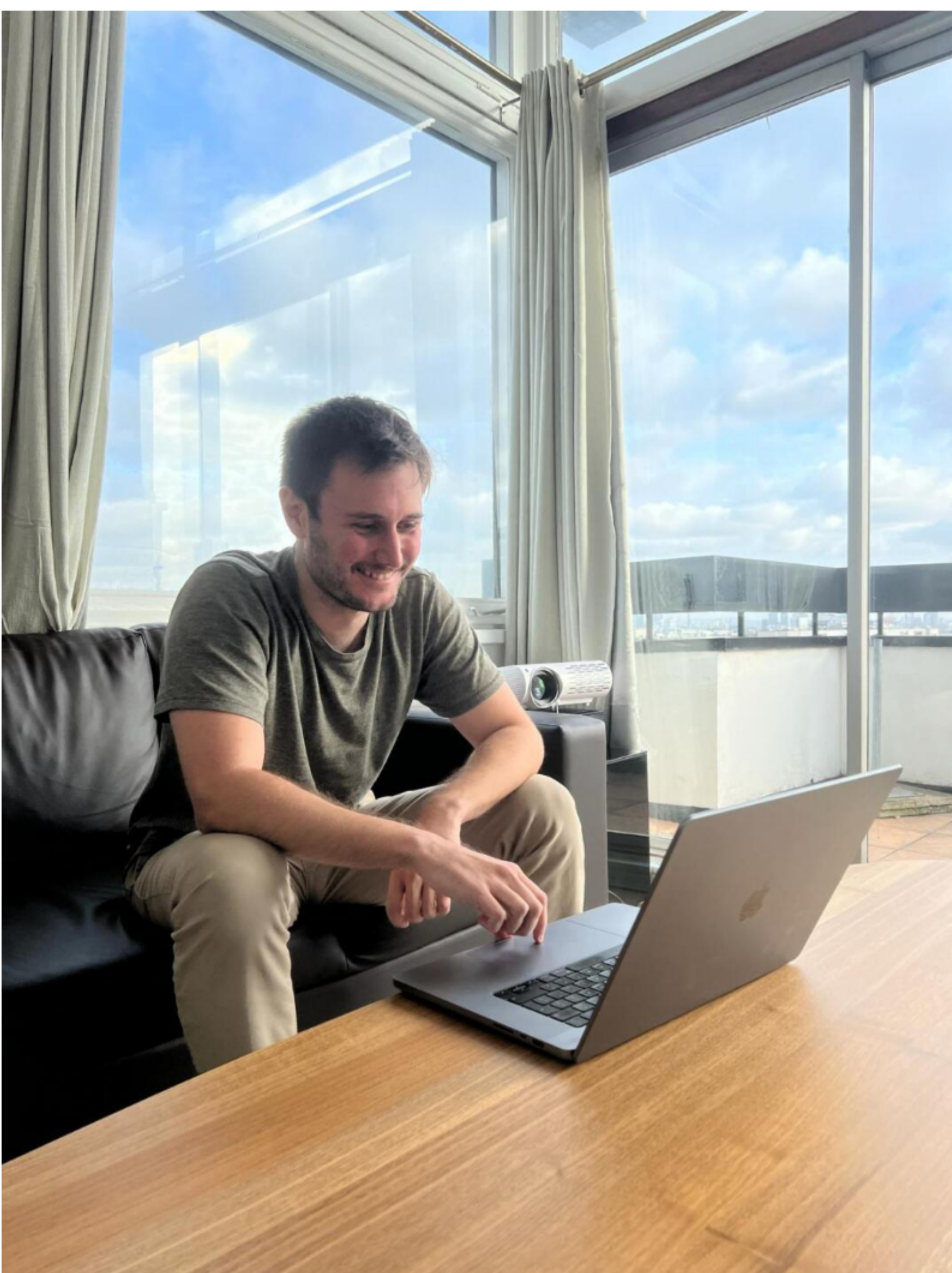
Puppeteer: Es una herramienta conversacional con IA que permite automatizar ciertas acciones en una empresa de salud

Sobre el dinero, dijo que estará dirigido a a tres objetivos: contratar desarrolladores para seguir generando el producto, contratar profesionales para marketing y en acciones de branding para potenciar la marca, por ejemplo, participando en conferencias de salud en EE.UU. o patrocinio de eventos y podcasts de salud.