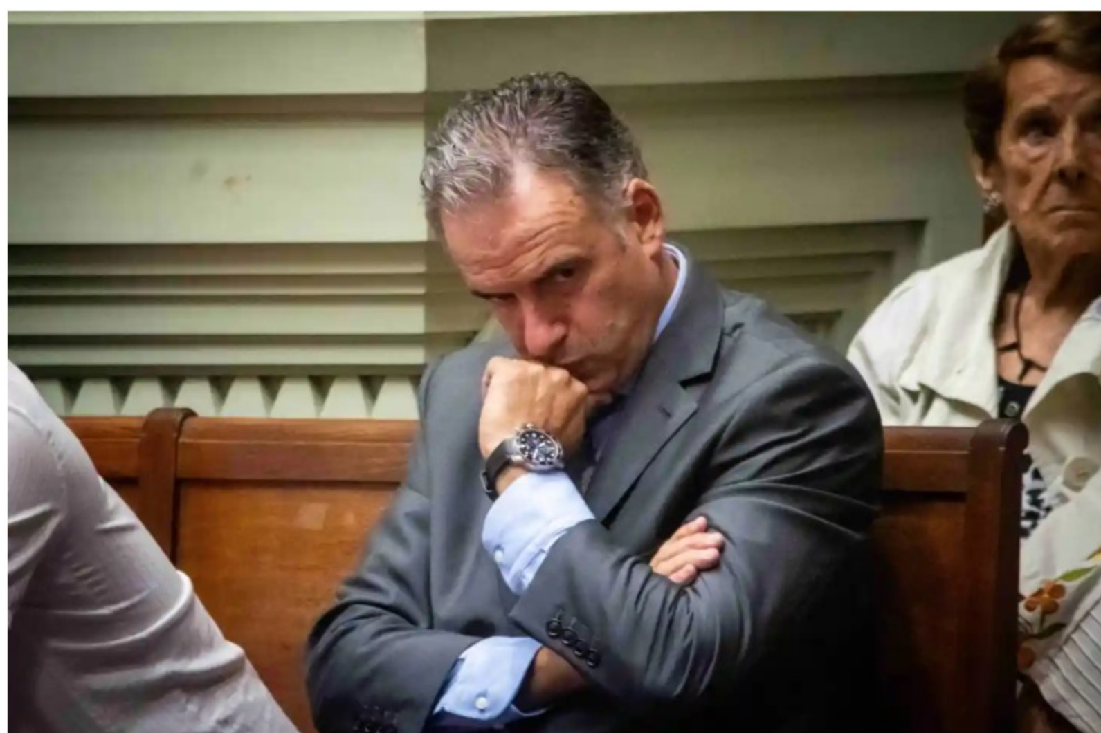
Yamandú Orsi en el Senado.

El 1° de marzo asumirán las nuevas autoridades de las agencias e instituciones que integrarán la primera instancia de coordinación. La ANII es una de las agencias que forman parte de este ecosistema.