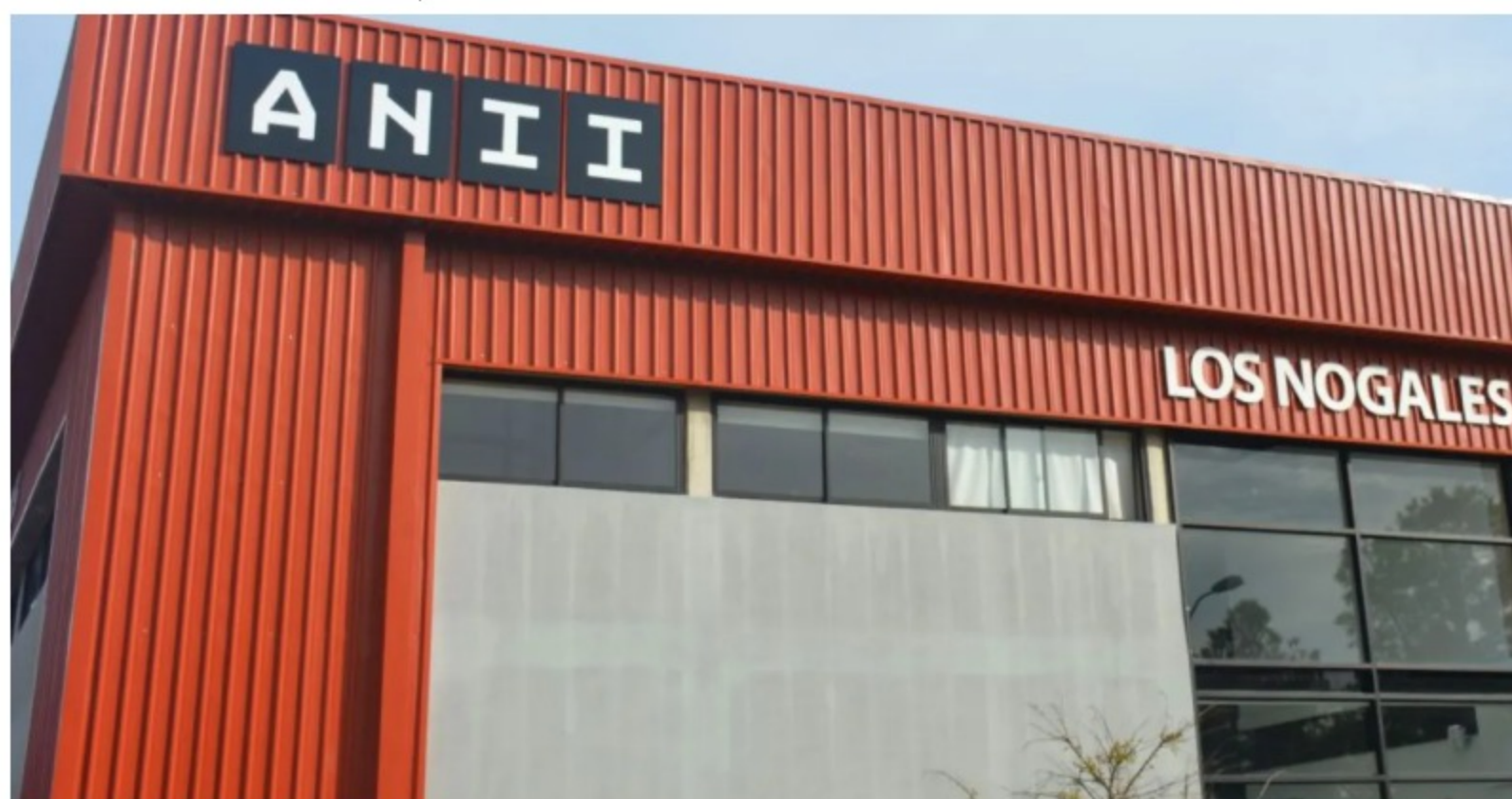
Agencia Nacional de Investigación e Innovación.